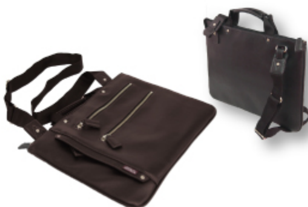
薄マチショルダーM 横型