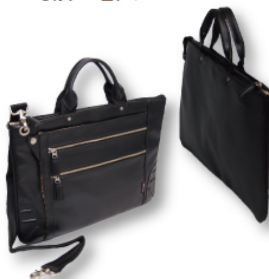
薄マチショルダーL 横型