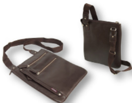
薄マチショルダーS 縦型