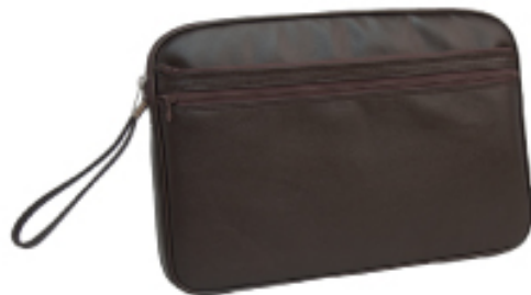
No. 3559 ●Size:W36×H24×D4cm ●上代:¥3,300+税 ●カラー:■クロ ■チョコ