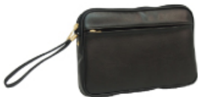
No. 4621 ●Size:W24×H17×D3cm ●上代:¥2,500+税 ●カラー:■クロ