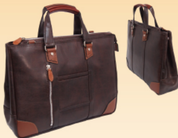
Valeitino Sabatini 3211 トート型ビジネス