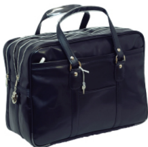
No.3517 銀行ポストン サイズ:W45×H32×D20cm 上代:11,000円+税 生産国:日本