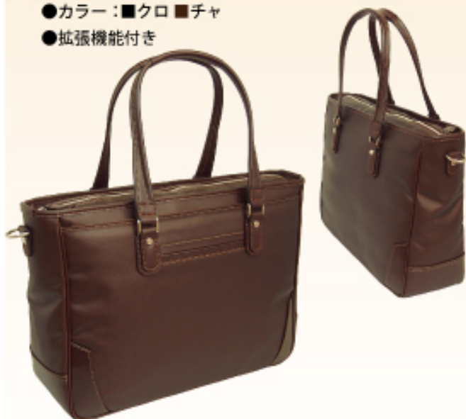
Royal SunScott 3541 ビジネストート