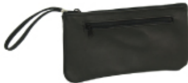
No. 3558 ●Size:W27×H14cm ●上代:¥1,600+税 ●カラー:■クロ ■チョコ