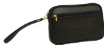
No. 4623 ●Size:W19×H13×D2cm ●上代:¥2,200+税 ●カラー:■クロ