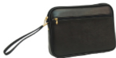
No. 4622 ●Size:W22×H16×D3cm ●上代:¥2,300+税 ●カラー:■クロ