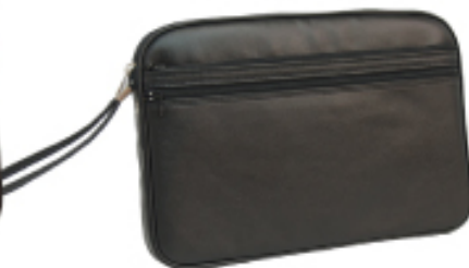
No. 3560 ●Size:W33×H22×D4cm ●上代:¥3,000+税 ●カラー:■クロ ■チョコ