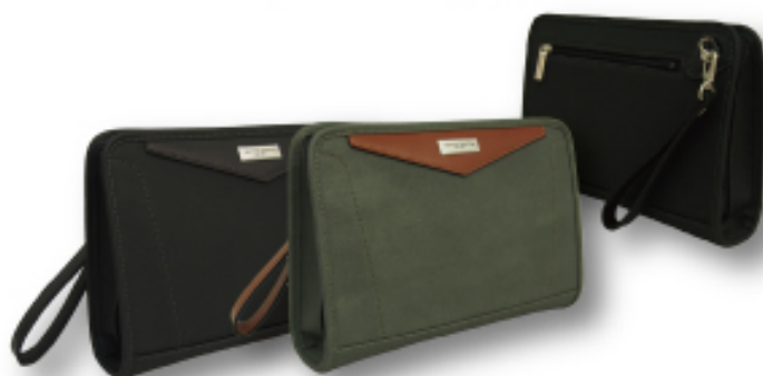
Valentino Sabatini 3572 三角ポーチL

●サイズ:W21×H15×D5cm ●上代:¥6,300+税 ●カラー:■クロ ■カーキ