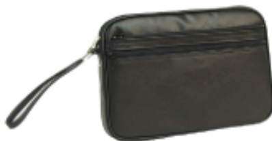
No. 3562 ●Size:W27×H18×D4cm ●上代:¥2,600+税 ●カラー:■クロ ■チョコ