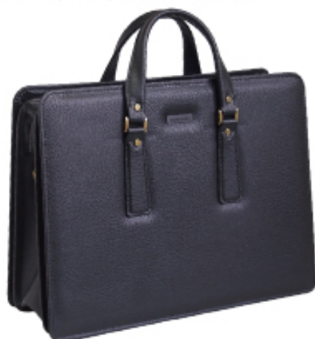
No.3533 銀行ビジネスバッグ サイズ:W42×H32×D21cm 上代:10,000円+税 生産国:日本