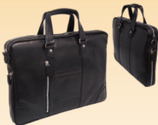
Valeitino Sabatini 3210 二本手ビジネス