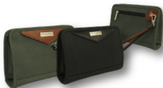
Valentino Sabatini 3571 三角ポーチS

●サイズ:W21×H15×D5cm ●上代:¥6,300+税 ●カラー:■クロ ■カーキ