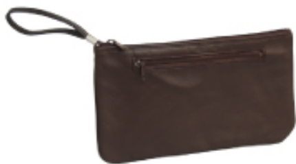
No. 3557 ●Size:W30×H17cm ●上代:¥1,700+税 ●カラー:■クロ ■チョコ