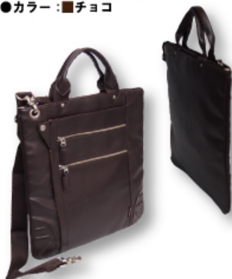
薄マチショルダーL 縦型