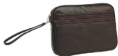
No. 3563 ●Size:W24×H16×D3cm ●上代:¥2,500+税 ●カラー:■クロ ■チョコ