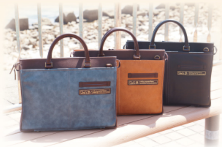
Valeitino Sabatini 3537 トート型ビジネス