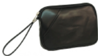
No. 4624 ●Size:W20×H14×D3cm ●上代:¥1,500+税 ●カラー:■クロ