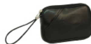
No. 4625 ●Size:W18×H13×D3cm ●上代:¥1,400+税 ●カラー:■クロ