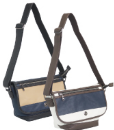
[No.3162] ショルダーバッグ